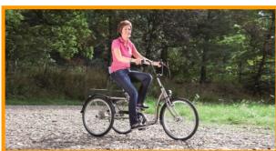
Fahrkomfort neu definiert