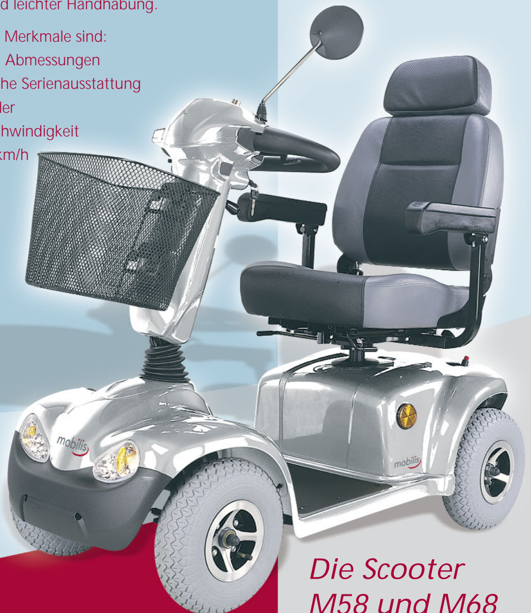
Die Scooter M58 und M68