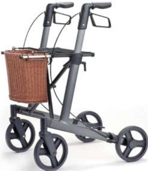
Abbildung: Rahmengröße M mit Einkaufskorb (Sonderausstattung)

Die klare technische Linie, das funktionale Design und ein sinnvolles Angebot von Zubehörteilen machen den brado zu dem, was er ist: Eine elegante und zuverlässige Gehhilfe für unterwegs - garantierte Qualität inklusive.